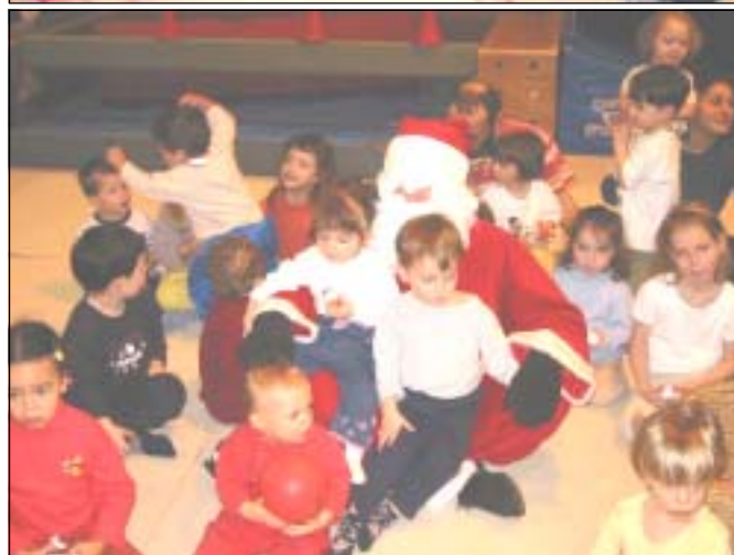
Le Père Noël a rendu visite à la section Gym