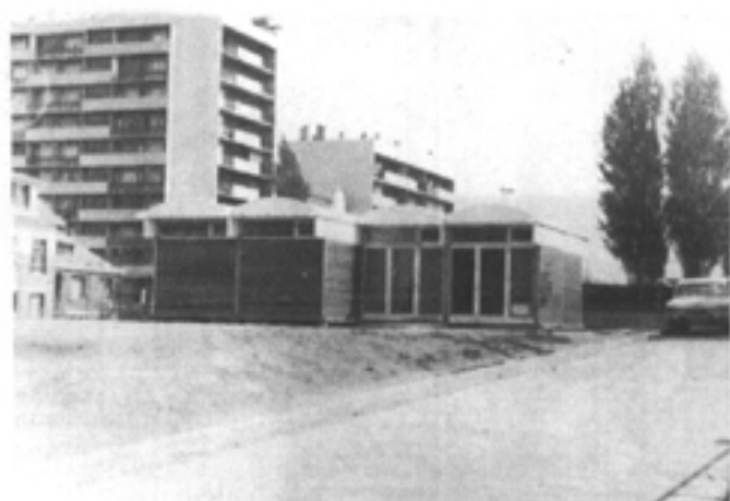
CENTRE CULTUREL - 3 Bd Chastenot de Géry