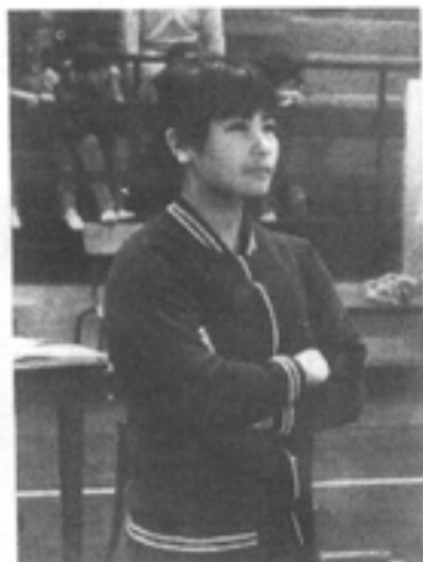
Keiko ISHIKAWA (Championne du Japon)