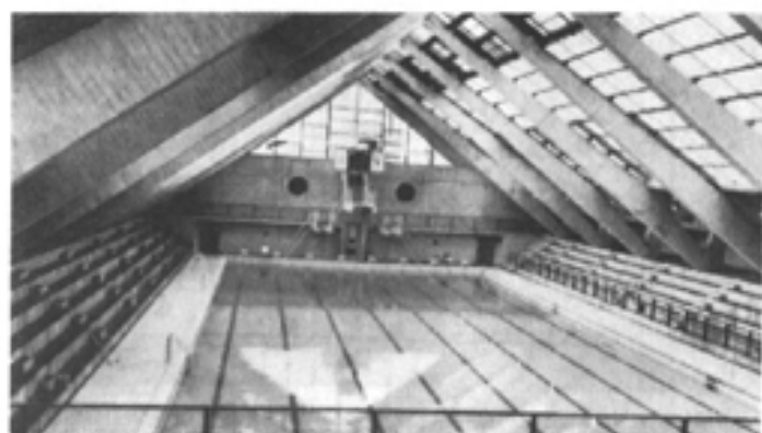
PISCINE MUNICIPALE OLYMPIQUE - 35 Rue Séverine

LES INSTALLATIONS SPORTIVES ET CULTURELLES