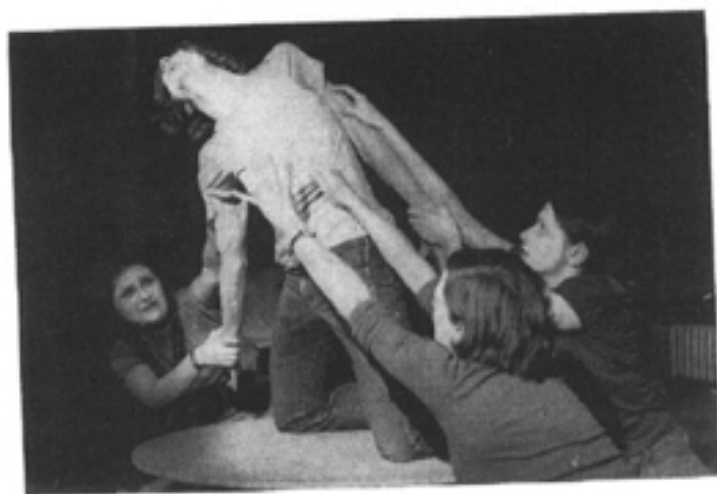
THEATRE : Le Damné