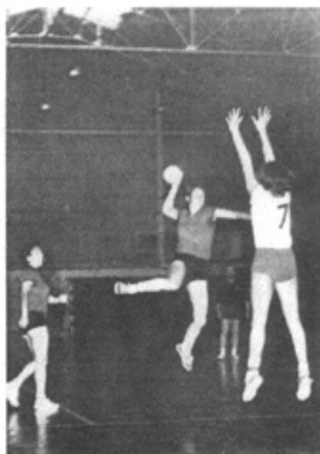
HAND-BALL Féminin U.S. IVRY