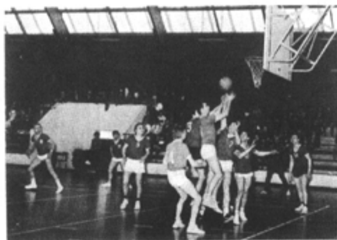
BASKET-BALL: un match très disputé