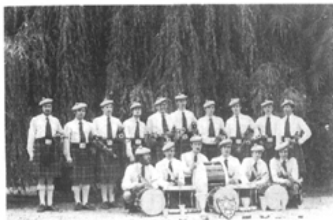
Le "BAGAD AN ERE"