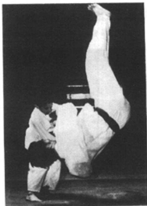
JUDO pour petits et grands