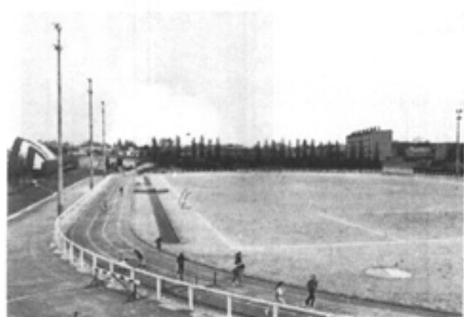
STADE MUNICIPAL DES ESSELIÈRES - 59 Rue Prof. Bergonié

SALLE DES FÊTES 5 Rue Pierre Brossolette