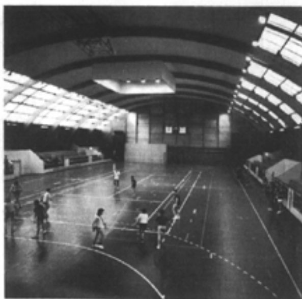
SALLE DES SPORTS - 5 Bd Chastenot de Géry