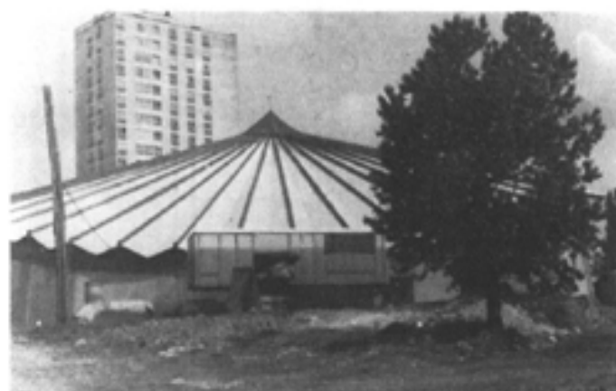
ANTENNE CULTURELLE - Rue Marcel Sembat