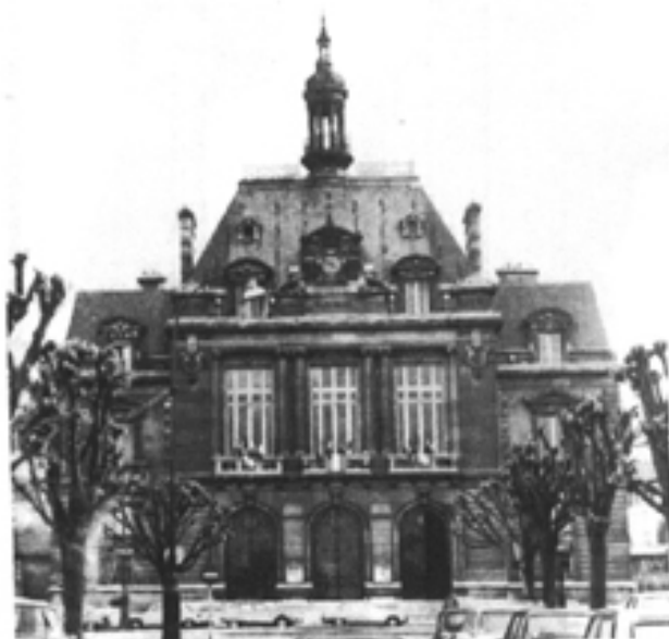
MAIRIE du KREMLIN - BICETRE