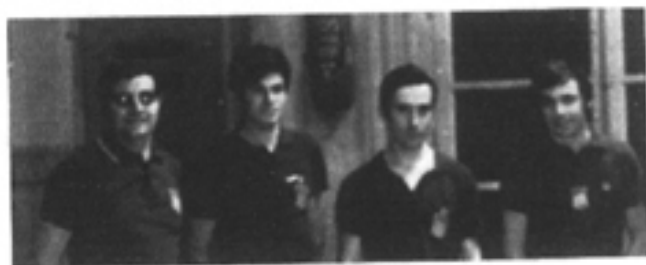
Internationaux de TENNIS de TABLE