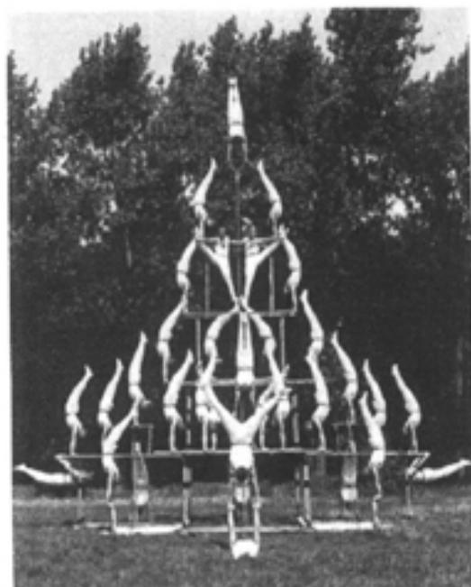
Section Spéciale de Gymnastique de la Garde Républicaine