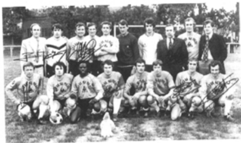
Les VA NU PIEDS