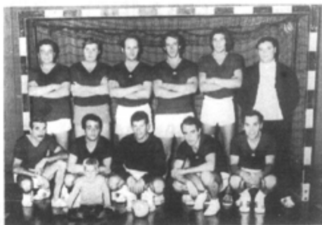
L'Equipe de HAND-BALL du C.S.A.K.B.