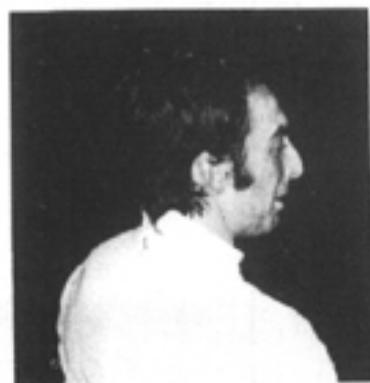
Christian NOËL, (Champion de France, du Monde, Olympique)