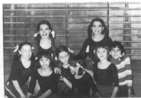
Equipe Minime du C.S.A.K.B. (Championne du Val de Marne, 2 ème Division 1972)