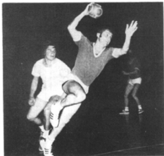
HAND-BALL Masculin U.S. IVRY