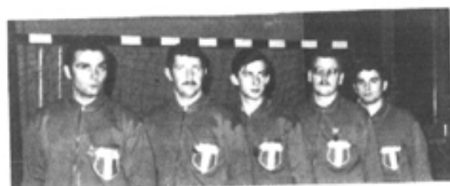
Internationaux de TENNIS de TABLE